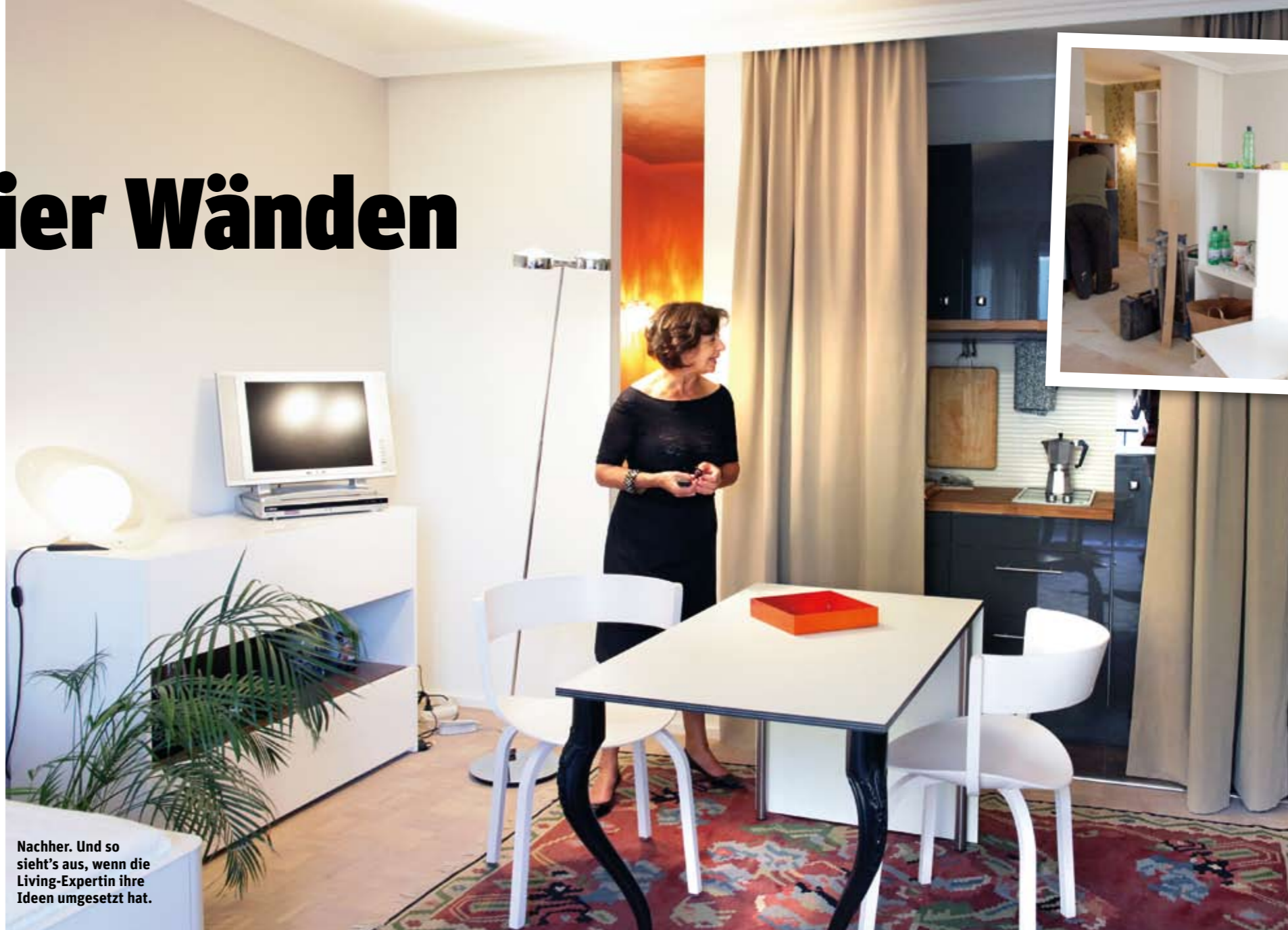
Nachher. Und so sieht's aus, wenn die Living-Expertin ihre Ideen umgesetzt hat.